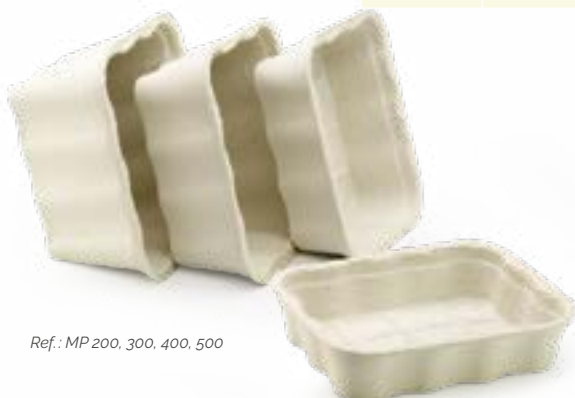
Ref.: MP 200, 300, 400, 500