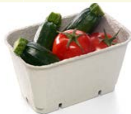
Ref.: MP 37