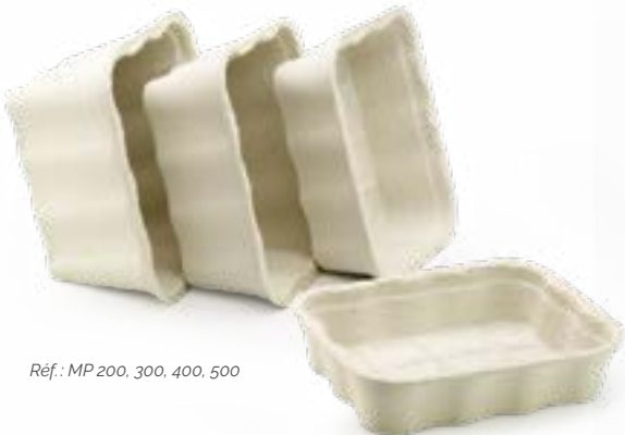
Réf.: MP 200, 300, 400, 500