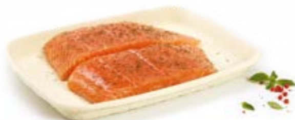
Réf.: OP 4 SK