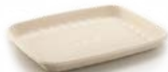
Réf.: OP 3 SK