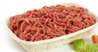
Réf.: OP 11 K